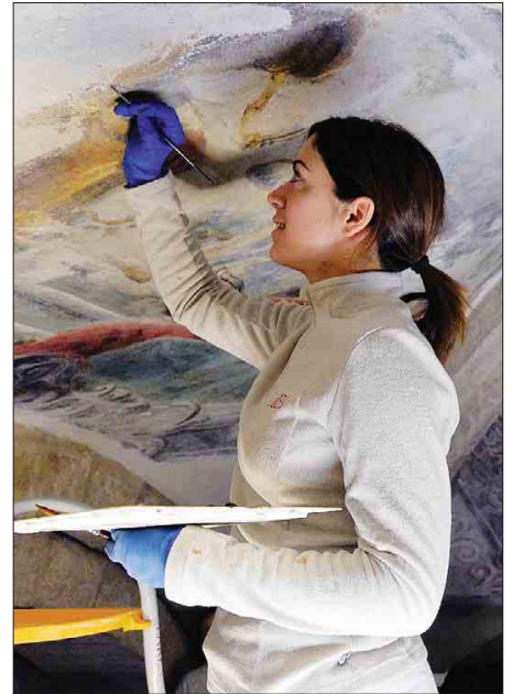
I dipinti, come appurato dagli esperti, risalgono al Settecento

Ad oggi è stata ultimata una fase di indagini sui suddetti pi-