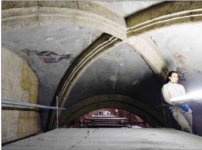
L'intervento nella navata nord: gli affreschi erano sotto le tinteggiature delle volte

Una storia, quella del restauro di questa grande struttura, che è in continua evoluzione e Bonapace ce la riassume con passione, concentrandosi su-